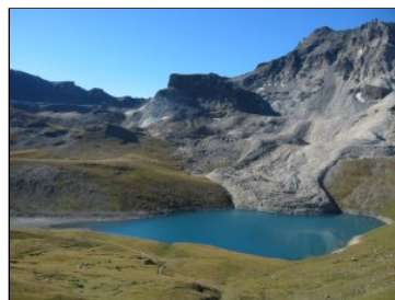
Le lac de Lona