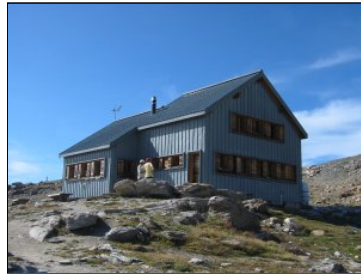
La cabane des BeCs de Bosson