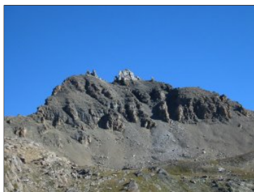
Les Becs de Bosson