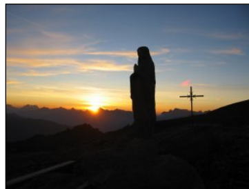
Vierge à proximité de la cabane