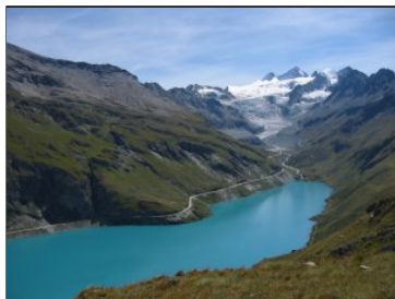
Les eaux turquoise du lac de Moiry